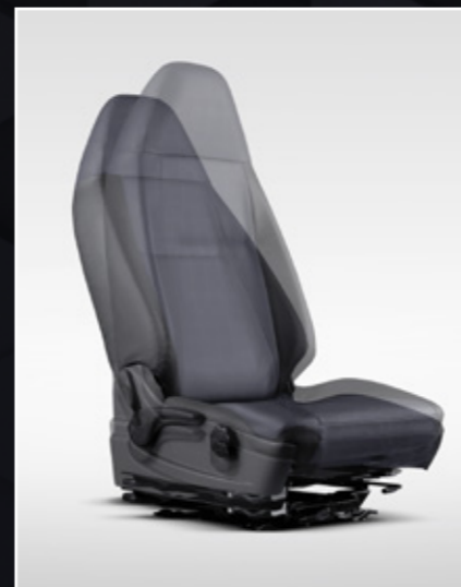
AIR SUSPENSION SEAT

Dengan Exhaust Gas Recirculation (EGR) dan Positive Crankcase Ventilation (PCV) yang didukung oleh Diesel Oxidation Catalyst (DOC) Muffler menghasilkan emisi gas buang ramah lingkungan.