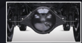
RASIO GARDAN BESAR

Kamera Belakang Memudahkan pengemudi melihat area belakang melalui spion tengah saat mundur.